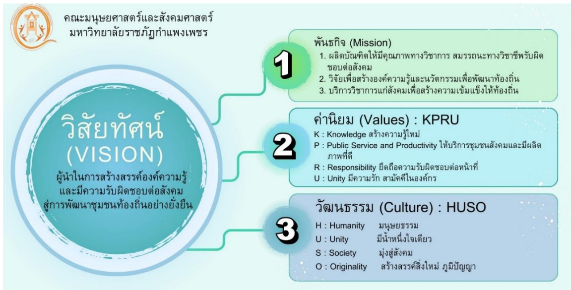
ภาพที่ OP-1 วิสัยทัศน์ พันธกิจ ค่านิยม และวัฒนธรรม

(2) วิสัยทัศน์ พันธกิจ ค่านิยม และวัฒนธรรม (Vision, Mission, Values, and Culture) คณะมนุษยศาสตร์และสังคมศาสตร์มีวิสัยทัศน์ พันธกิจ ค่านิยม และวัฒนธรรม ดังนี้