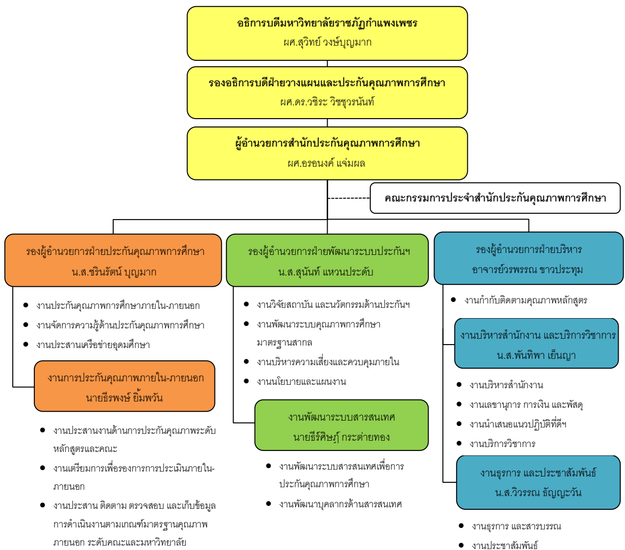
ภาพที่ OP.1 โครงสร้างสำนักประกันคุณภาพการศึกษา มหาวิทยาลัยราชภัฏกำแพงเพชร